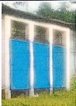
Foto 3: Puertas remozadas y pintura anticorrosiva en los inodoros