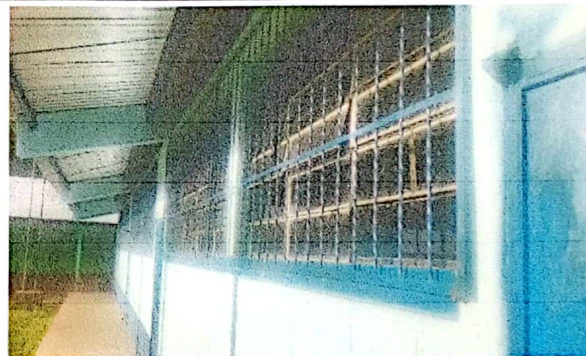
Foto 4: Ventanas remozadas, cambio de vidrios y balcones colocadas