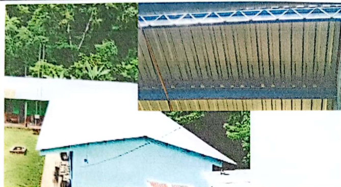
Foto 1: Cambio de entechado y remozamiento de estructura metálica