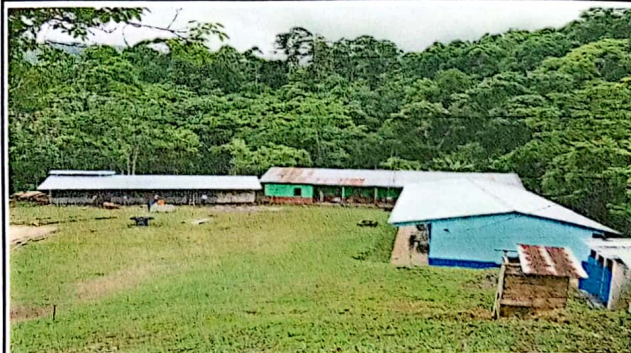
Foto 6: Vista General incluyendo la cocina despues del remozamiento

Observación: Si es necesario se pueden agregar hojas adicionales y actualizar el número de hojas.