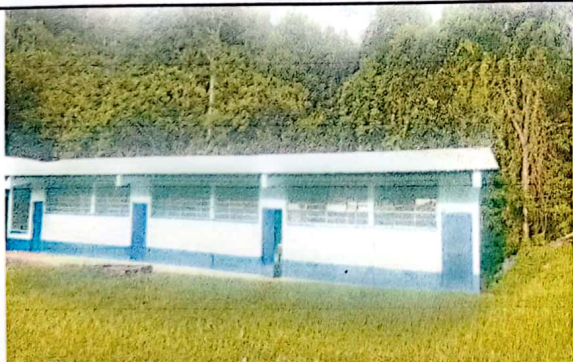
Foto 5: Vista del edificio Escolar despues de terminar el remozamiento