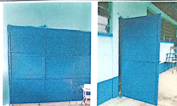
Foto 2: Remozamiento de puertas y aplicación de pintura anticorrosiva del edificio escolar